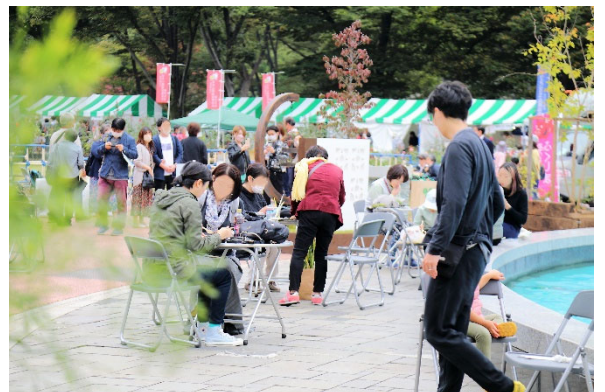
令和4年開催時の様子

東京都、国土交通省、環境省、千代田区、中央区、公益財団法人都市緑化機構、一般社団法人日本公園緑地協会、公益社団法人日本造園学会、一般財団法人東京マラソン財団、都市緑化推進運動協力会