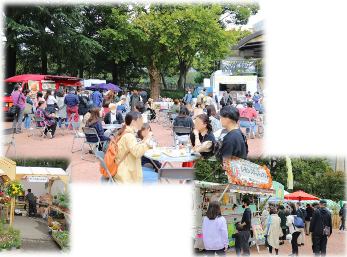
過去の出展・出店の様子

都心のオアシス、日本初の近代洋風公園である日比谷公園で令和5年10月21日(土)～10月29日(日)に開催される「第21回日比谷公園ガーデニングショー2023」について、開催趣旨に沿った、花と緑・環境に関連する事業や植物・資材等を展示・販売できるテント出展や、キッチンカーによる飲食出店を募集いたします。今年のテーマは『しあわせ広がる日比谷の秋』。皆さまのエントリーをお待ちしております！