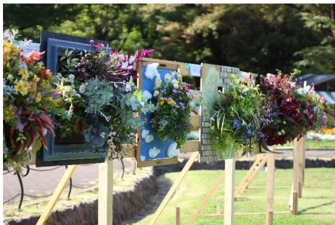
令和5年作品展示の様子

東京都、国土交通省、農林水産省、環境省、千代田区、中央区、公益財団法人都市緑化機構、一般社団法人日本公園緑地協会、公益社団法人日本造園学会、一般財団法人東京マラソン財団、都市緑化推進運動協力会