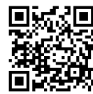
コンテスト 応募フォーム

※応募の際にご提出いただく個人情報、当コンテスト以外の目的には使用いたしません。