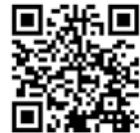
日比谷公園ガーデニングショー 公式ホームページ

公式ホームページ： https://www.hibiya-gardening-show.com/